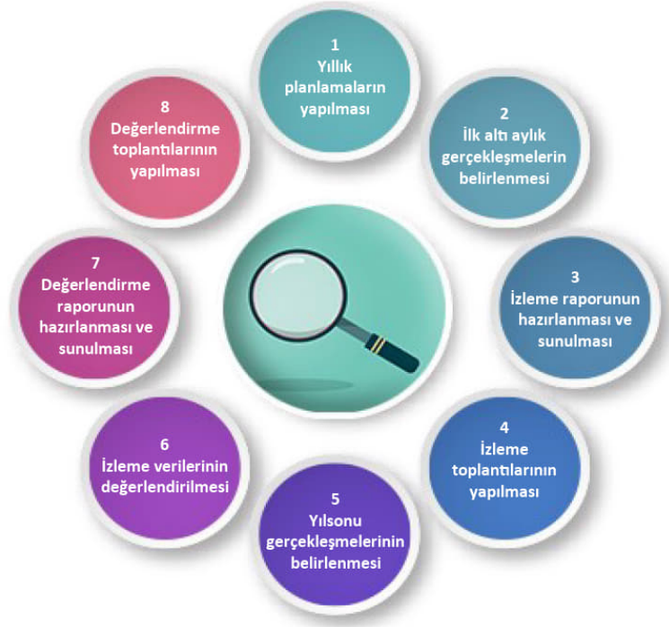
Şekil-4 İzleme ve Değerlendirme Süreci

İzleme ve değerlendirme sürecinin işleyişi ana hatları ile yukarıdaki şekilde özetlenmiştir.